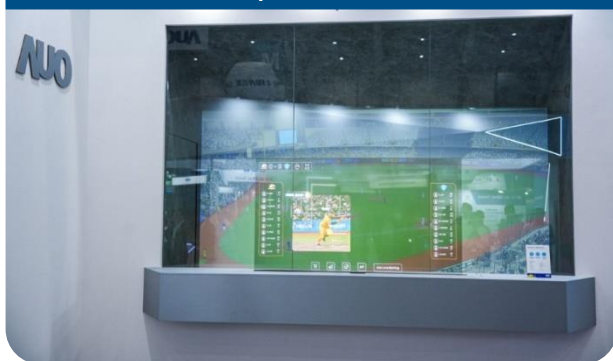
64-inch Sports AR Solution